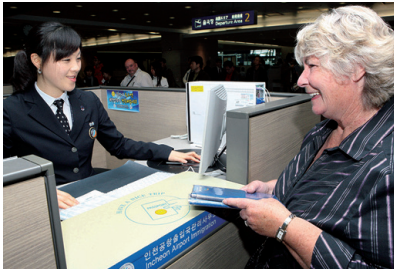
▶ 인천공항 입국심사장