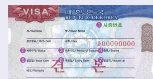
대한민국 비자 견본