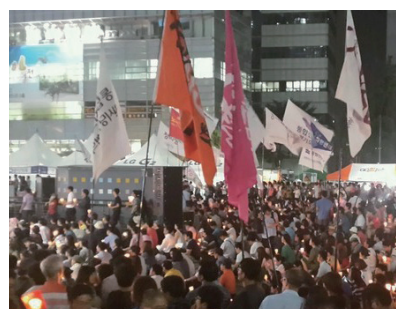
시위에 참가한 시민들