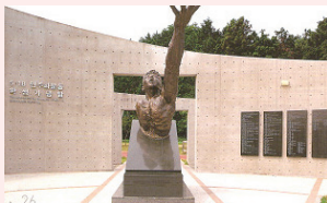
5·18 민주화운동 기념탑